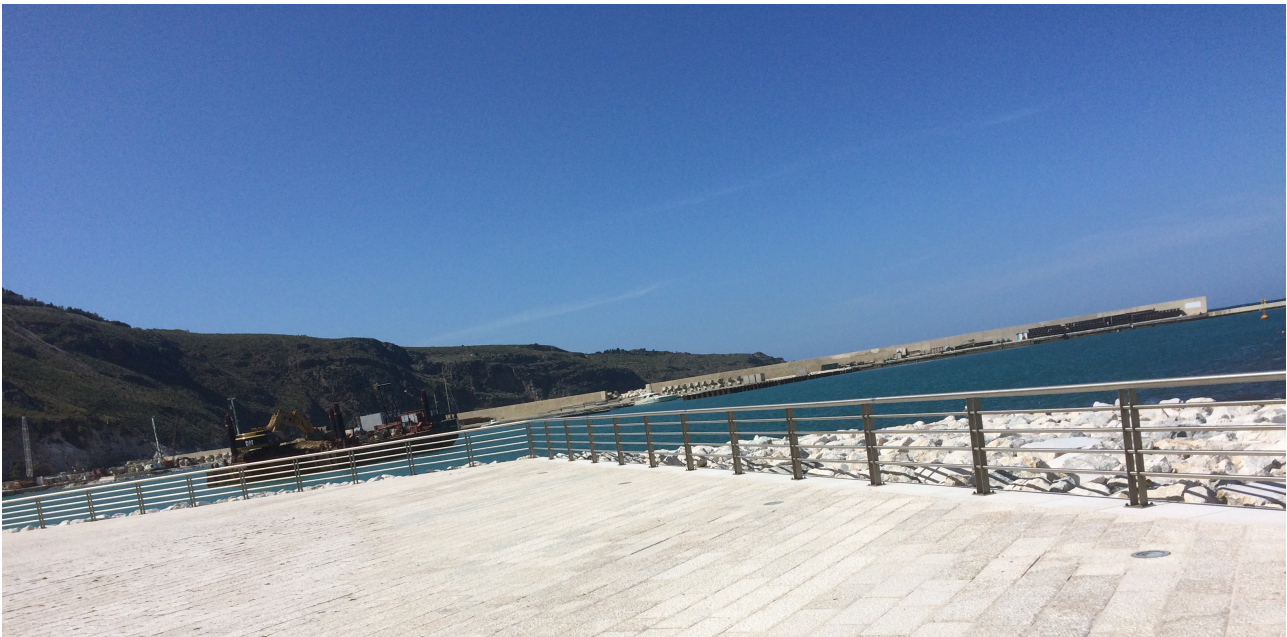
Porzione di Piazzale Stenditoio