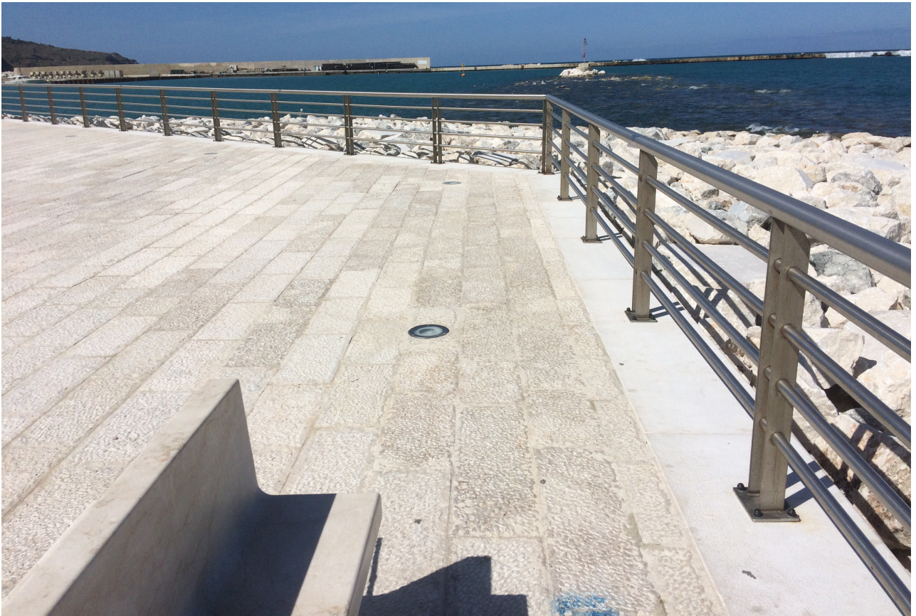
Porzione di Piazzale Stenditoio