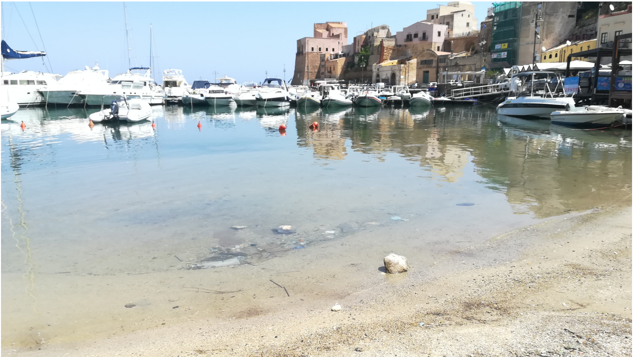
Porzione di Cala Marina