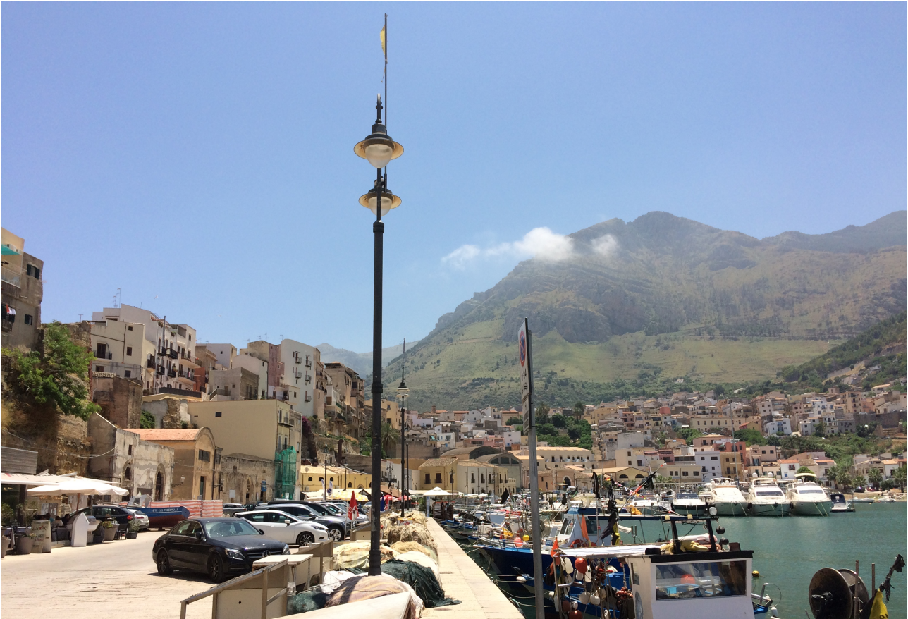
Particolare palo luce elettrico in cui verranno inserite le telecamere